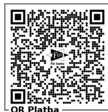
Pololetní platba 500 Kč